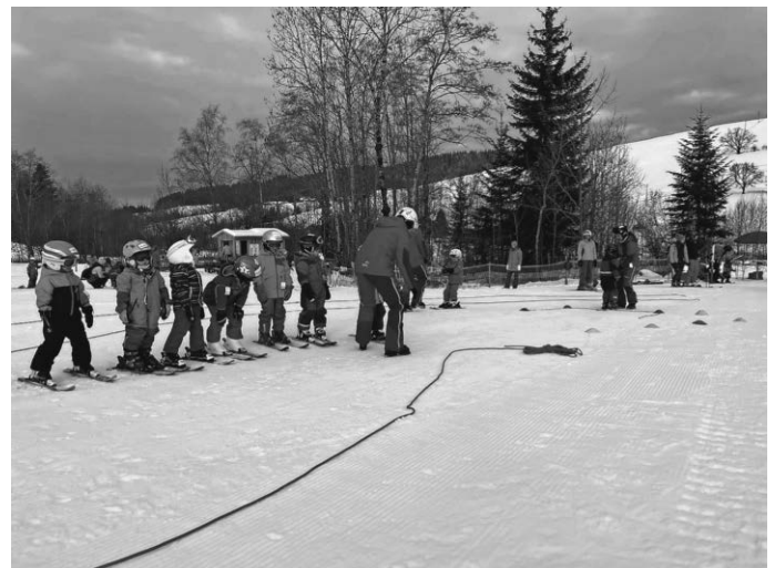
Die ersten Kurven