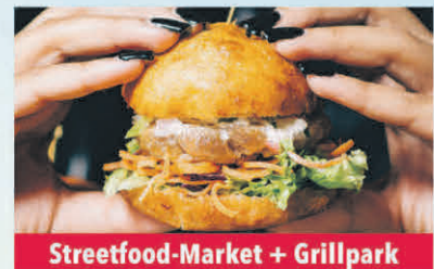
Streetfood-Market + Grillpark