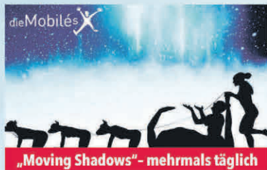
„Moving Shadows“- mehrmals täglich