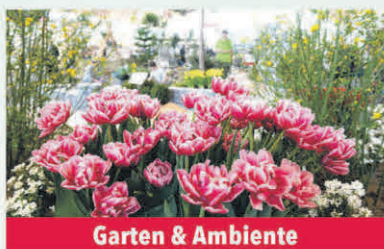
Garten & Ambiente