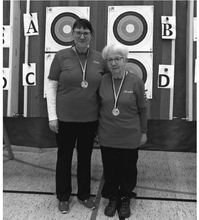
2x Gold für den KKSv

Wieder eine sehr erfolgreiche Meisterschaft für die kleine Para Abteilung des KKSv Karsee.