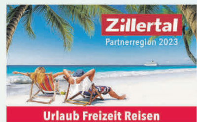
Zillertal Partnerregion 2023 Urlaub Freizeit Reisen