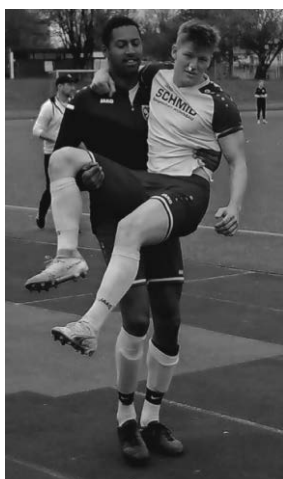
Einer für alle, alle für Einen # Teamspirit

Nun gilt es dieses Glücksgefühl in die nächsten Partien mitzunehmen um den Rückstand auf die Nichtabstiegsplätze immer weiter zu verringern.