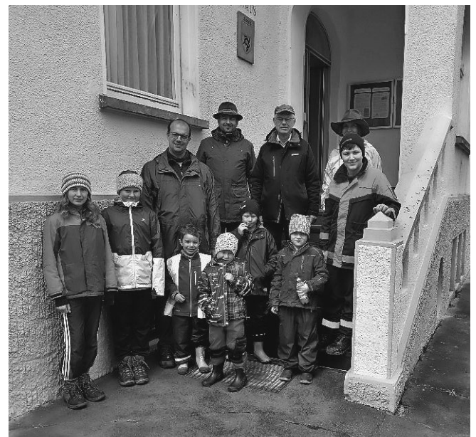
Die fleißige Truppe aus Leupolz

Herzlichen Dank an alle Beteiligten für das tolle Engagement!