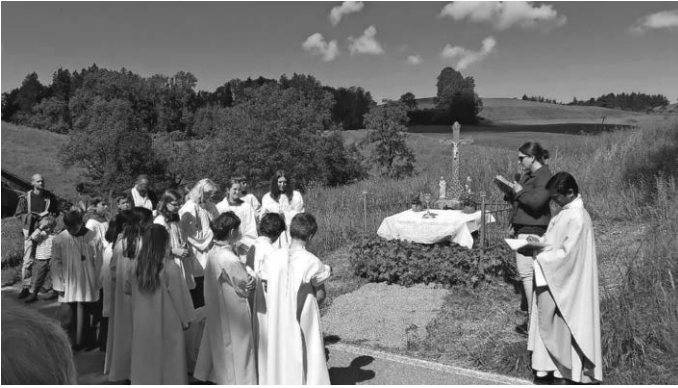
Station beim Wegkreuz in Engelsweiler