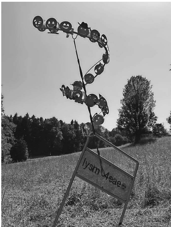
LOVE YOU SO MUCH FOR EVER AND EVER

Im Rahmen des 20-jährigen Jubiläums des Skulpturenwegs rings um den Karsee haben Jugendliche, Erwachsene am Samstag, 18. Juni bei einem Workshops mit dem Metallkünstler Mirko Siakou-Flodin eine sogenannte „Zeitgeistskulptur“ erschaffen. 42 Smiley - Emoji - eine zeitgemäße Idee wurde umgesetzt. Treffpunkt PLATZ neben der Skulptur des „Engelchens“ von Peter Lenk, wird das Schild neben die neue Skulptur aufgestellt. Begrüßung KuK, Erklärung vom Künstler, Bericht evtl. aus der Sicht eines/r Teilnehmers*in, Dank an die Sponsoren und anschließen Umtrunk und kleiner Imbiss bei der Treppenhause Galerie. Danach bieten wir eine kleine Führung durch die Treppenhause Galerie an. Wir freuen uns auf viele Besucher*innen - der Verien KuK