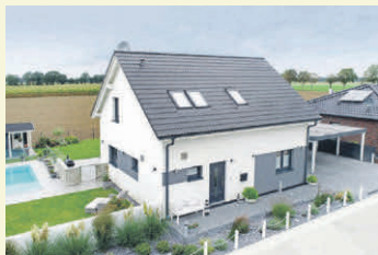
Mit Fertighäusern und einer guten Planung bleibt der Traum vom Eigenheim im Grünen realisierbar.

Mit dem passenden Konzept lässt sich der Traum vom Eigenheim noch verwirklichen