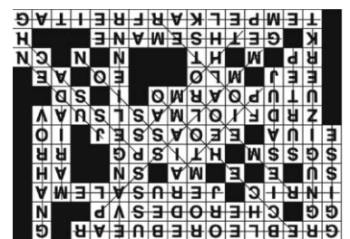
720R6672 Lösung: ESSI, EVANGELIEN, FOLTER, GETHEMANE, HERODES, ECCHEOMO, INRI, JERUSALEM, JUDAS, JUDEN, KARFREITAG, KREUZGANG, MARIA, MISSION, OELBERG, PASSALAMM, PESSACH, PETRUS, PIETA, RAEN, BER, ROEMER, TEMPEL, THOMAS, VORHANG

In dem Rätsel sind 24 Begriffe zur Passionsgeschichte versteckt. Sie finden diese, indem Sie die Buchstaben von links oder von rechts, von oben, von unten oder auch diagonal durchsuchen. Die Wörter können sich überschneiden. Nicht alle Buchstaben des Gitters werden verwendet.