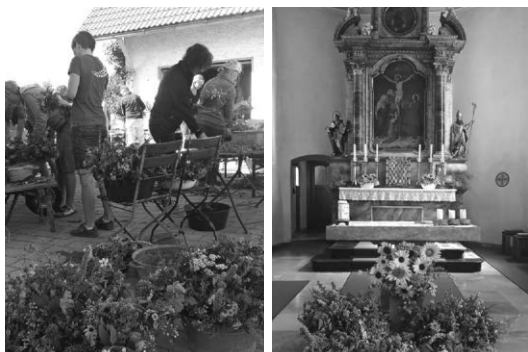
Mit viel Freude vertieft in die Arbeit

Viele Hände - schnelles Ende. So blieb den 12 LandFrauen aus Karsee nach dem gemeinsamen Kräuterbüschelbinden noch Zeit für eine große Tasse Kaffee mit Butterhörnla und Zopfbrot in der Sonne. Begleitet von dem herrlichen Duft der Kräuterbüschel die in liebevoller Handarbeit gefertigt wurden. Herzlichen Dank für die Kräuter und Blumenspenden, an die fleißigen Binderinnen und an Allen die uns mit Ihrer Spende für die Kräuterbüschel unterstützt haben. Somit konnten wir einen Betrag von 325 Euro im Klösterle in Wangen abgeben. Wir wollen hiermit den ausdrücklichen Dank weitergeben! Das Geld wird Bedürftigen zugutekommen, für Mittagessen oder auch Lebensmittel zum mitnehmen. Wo es halt gerade gebraucht wird - es ist in guten Händen. Ein spontaner Spaziergang im Klostergarten wurde dann noch zu einer kleinen Führung - immer wieder ein schönes Erlebnis. Der Garten ist immer offen und Gäste die ein Plätzchen zum verweilen suchen sind willkommen.