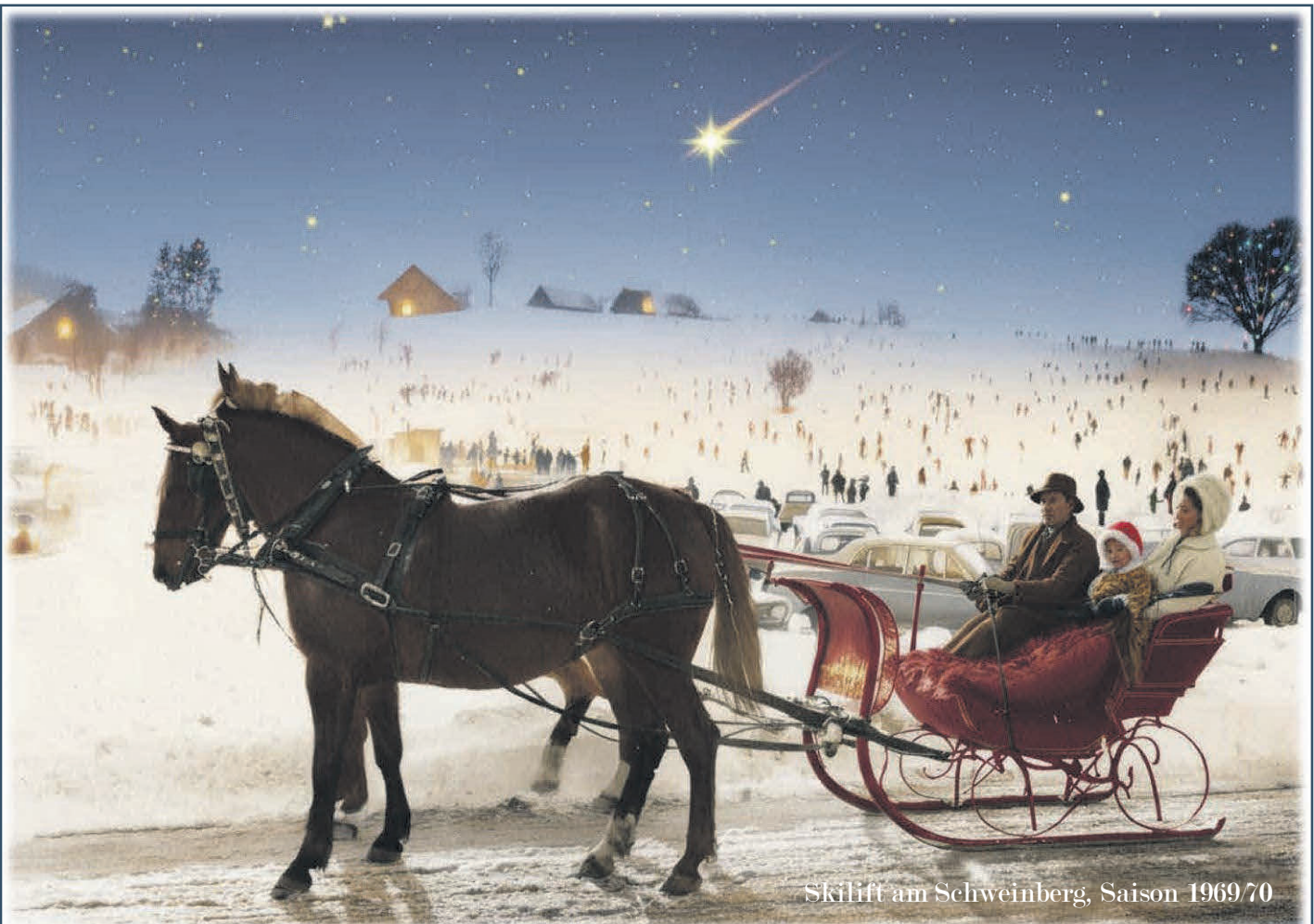
Skilift am Schweinberg, Saison 1969/70