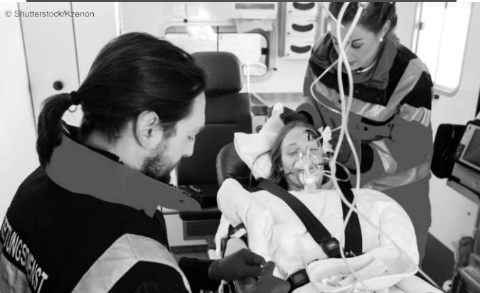
Ehrenamt beim Roten Kreuz